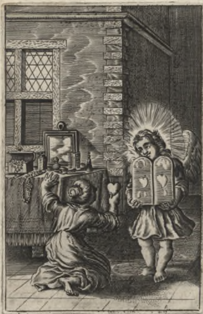
Fiat cor meum immaculatum in iustificationibus tuis, ut non confundar! Psalm. 118.