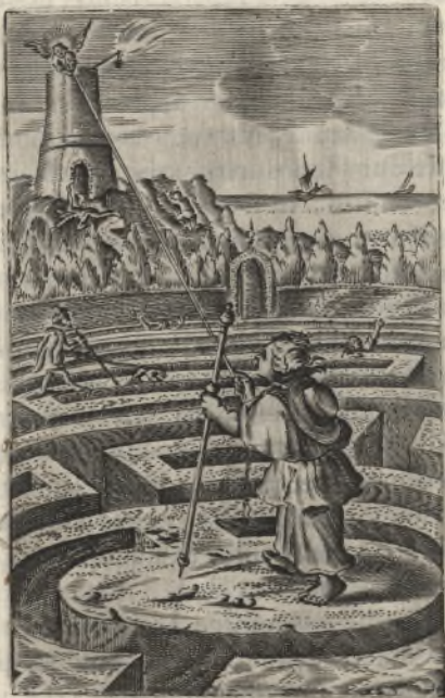
Vtinam dirigantur viae meae ad custodiendas iustificationes tuas! Psal. 118.