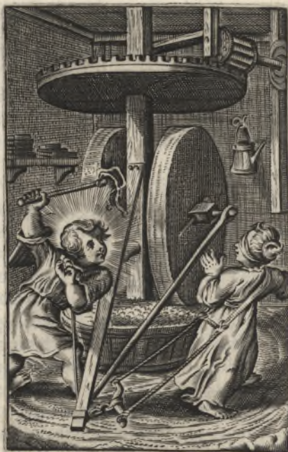
Vide humilitatem meam, & laborem meum : & dimitte vniversa delicta mea. Psalm. 24.