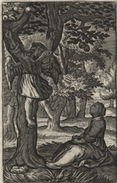
Sub Umbra illius quem desideraueram, sedi. Cantic. 2.