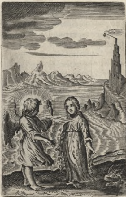
Anima mea liquefacta est, ut dilectus locutus est. Cantic. 5.