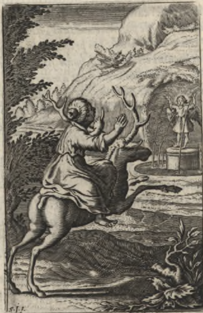
Quemadmodum desiderat cervus ad fontes aquarum ita desiderat anima mea ad te Deus. Pſal. 41.