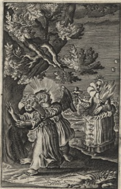
Averte oculos meos ne videant vanitatem. Psal. 118.