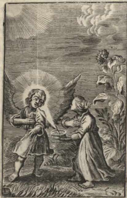
Ego dilecto meo, & ad me conversio ejus. Cantic. 7.