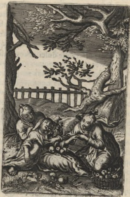
Fulcite me floribus, stipate me malis, quia amore languco. Cantic. 2.