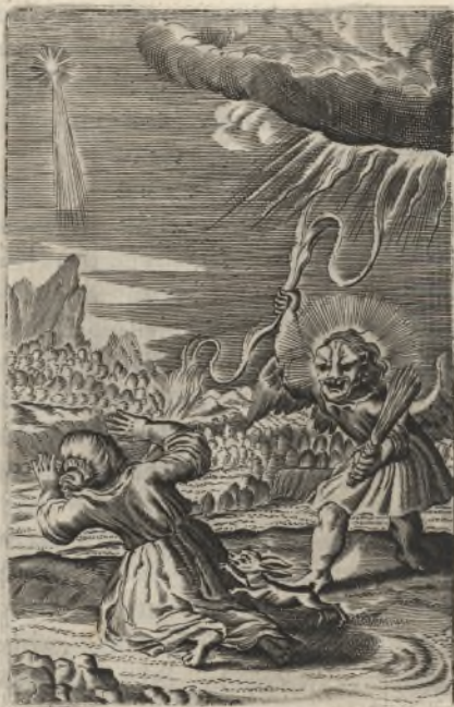
Confige timore tuo carnes meas , à judicijs animi tuis timui, Pſal. 118.

Confige timore tuo carnes meas , à judicijs enim tuis timui. Pſal. 118.