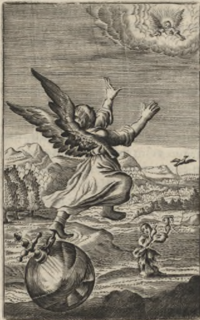
Coarctor autem è duobus; desiderium habens dissolui & esse cum Christo. Ad Philip. 1.