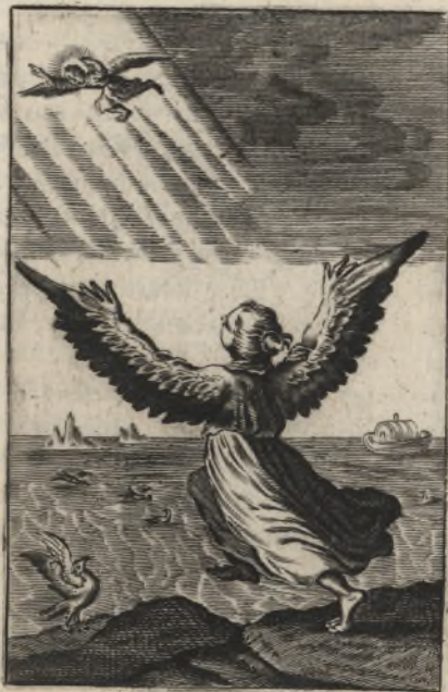
Quis dabit mihi pennas sicut colum- bæ, & volabo & requiescam? Psal. 54.