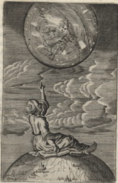
Quid enim mihi est in caelo, & à te quid volui super terram: Psal. 72.