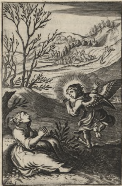
Fuge dilecte mi, & assimilare caprea, hinnuloq̄, cervorum super montes aromatum. Cant. 8.