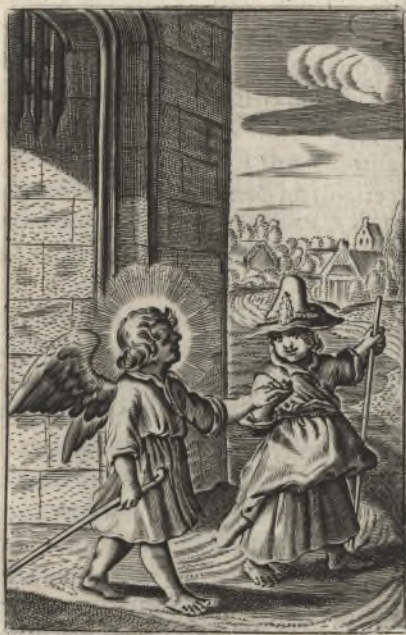
Veni dilecte mi, egrediamur in agrum, commoremur in villis, Cantic. 7.