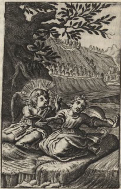
Quomodo cantabimus canticum Domini, in terra aliena? Psal. 136.