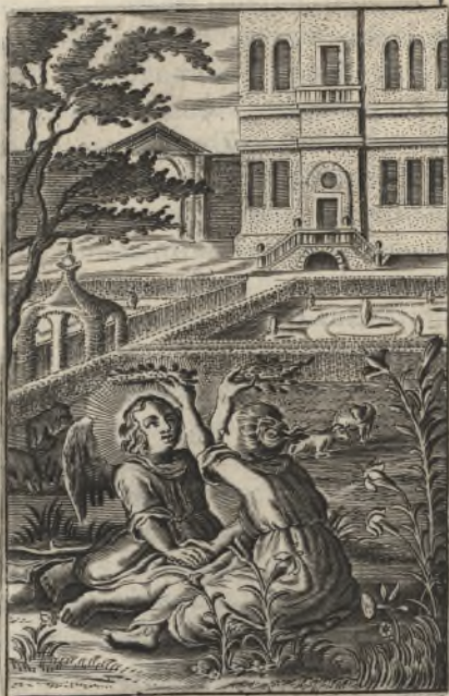
Dilectus meus mihi & ego illi qui pascitur inter lilia; donec aspiret di- es & inclinentur umbra, Cant. 2.