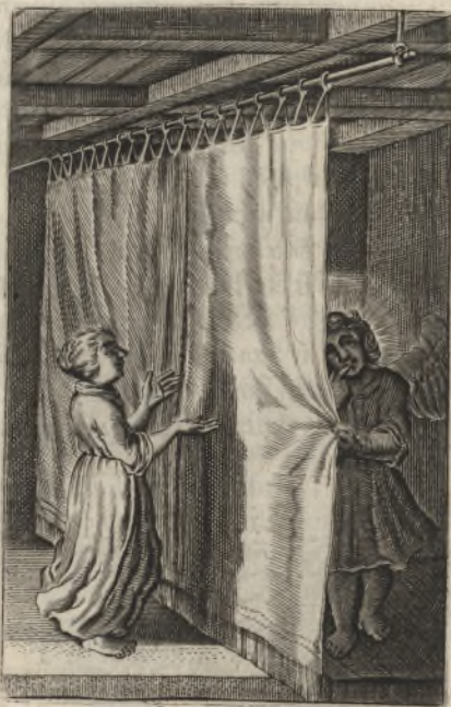
Quando veniam & apparebo ante faciem Dei? Psal. 41.