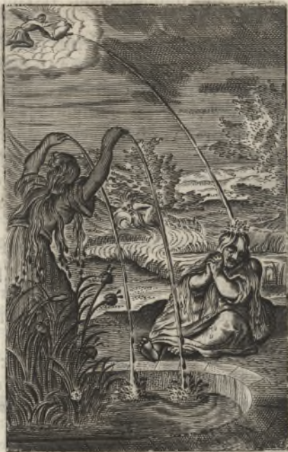
Quis dabit capiti meo aquam & oculis meis fontem lacrymarum? Hierem. 9.